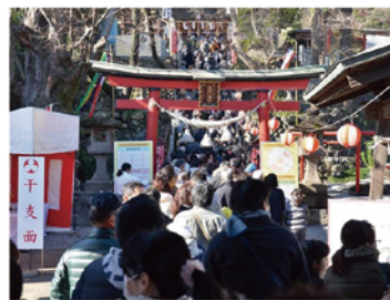
山名八幡宮の再生 参拝客が従来の5倍に急増