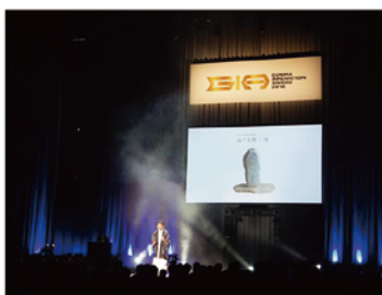
山名八幡宮ブランディング 群馬イノベーションアワード入選