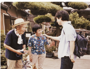
「家族のレシピ」ロケ誘致 南八幡地域の魅力を世界に発信