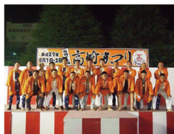
41回高崎まつり実施本部長 高崎青年会議所第63代 理事長