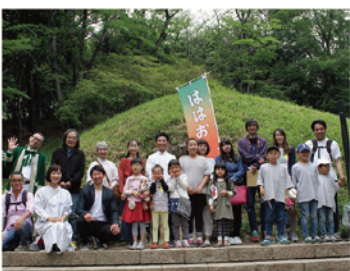
上野三碑をつなぐ会を結成 地域を巻き込んだイベントを開催